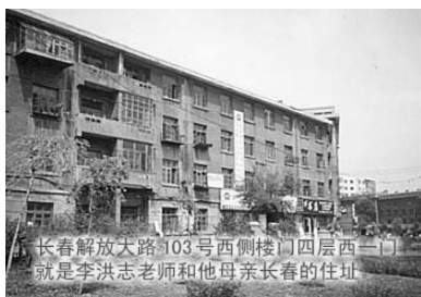
长春解放大路103号西侧楼门四层西二门就是李洪志老师和他母亲长春的住址

中国的喉舌舆论在一九九九年宣扬过，法轮功创始人李洪志先生长春豪华住宅如何如何，事过一年有余，笔者有幸赴长春亲眼目睹李洪志先生的所谓长春“豪宅”，本着实事求是的精神，孰正孰邪，昭然若揭。